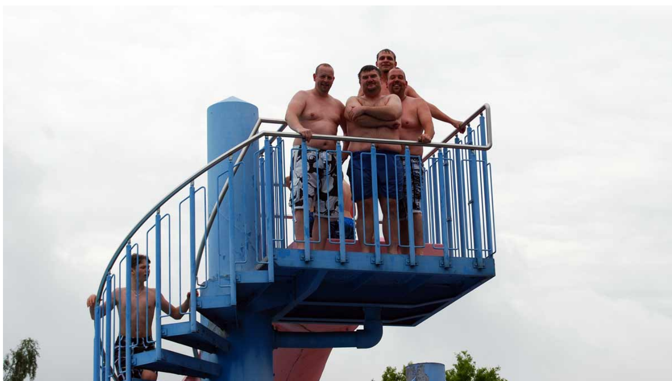
Feuerwehrlaute werden auf der Rutsche zu Kindern - mit Gruppenfoto!