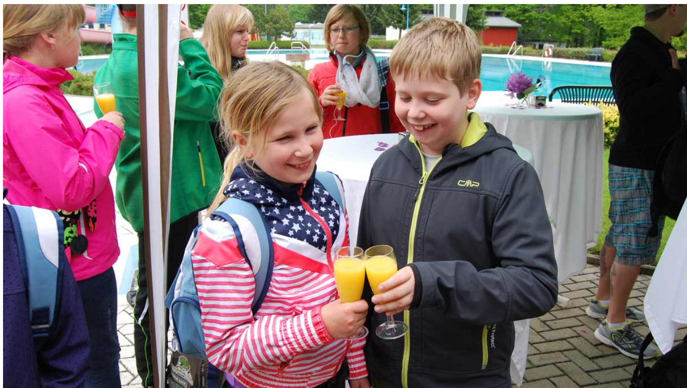
Die Jugendfeuerwehrleute stoßen mit Orangensaft an