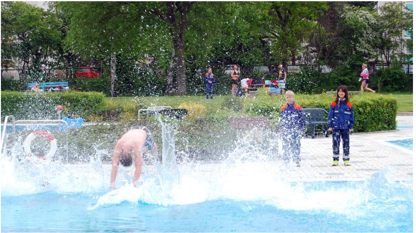
Nach dem Sprung