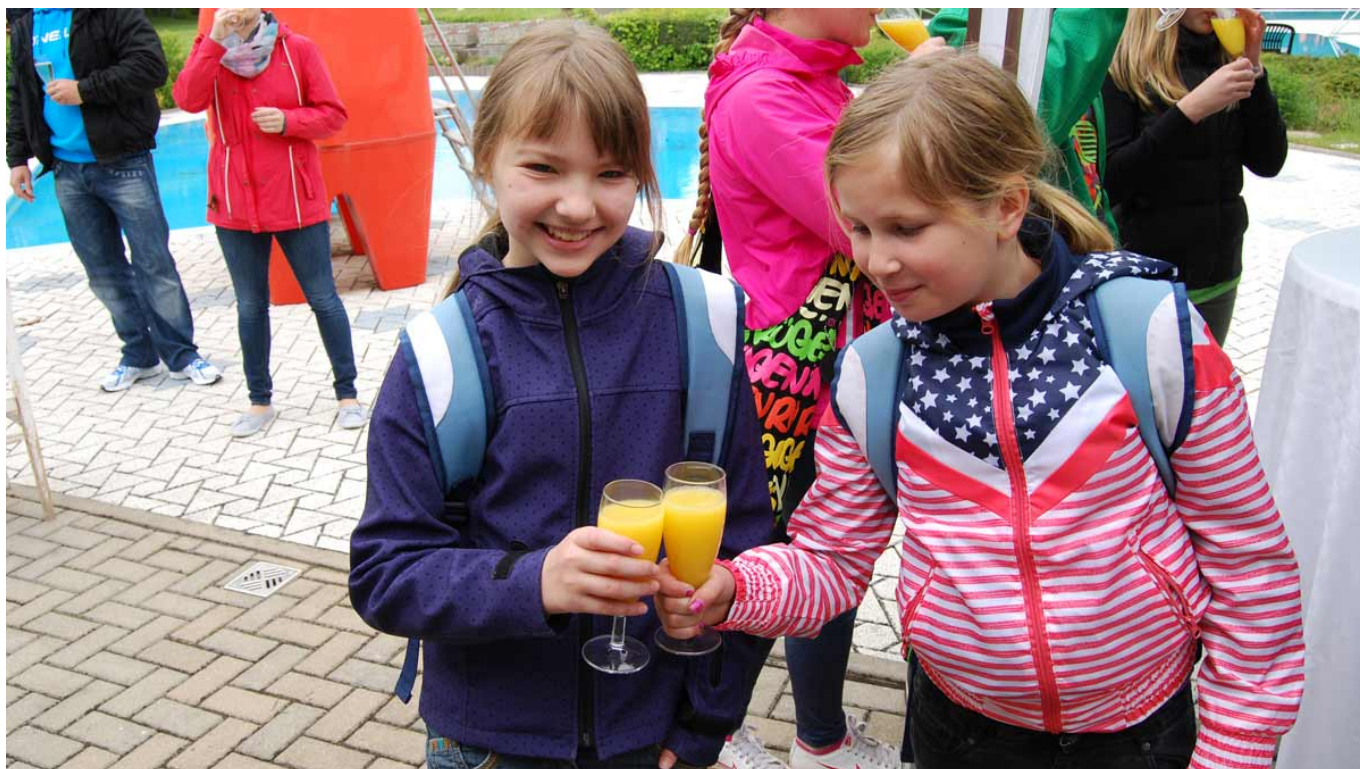
Die Jugendfeuerwehrlaute stoßen mit Orangensaft an