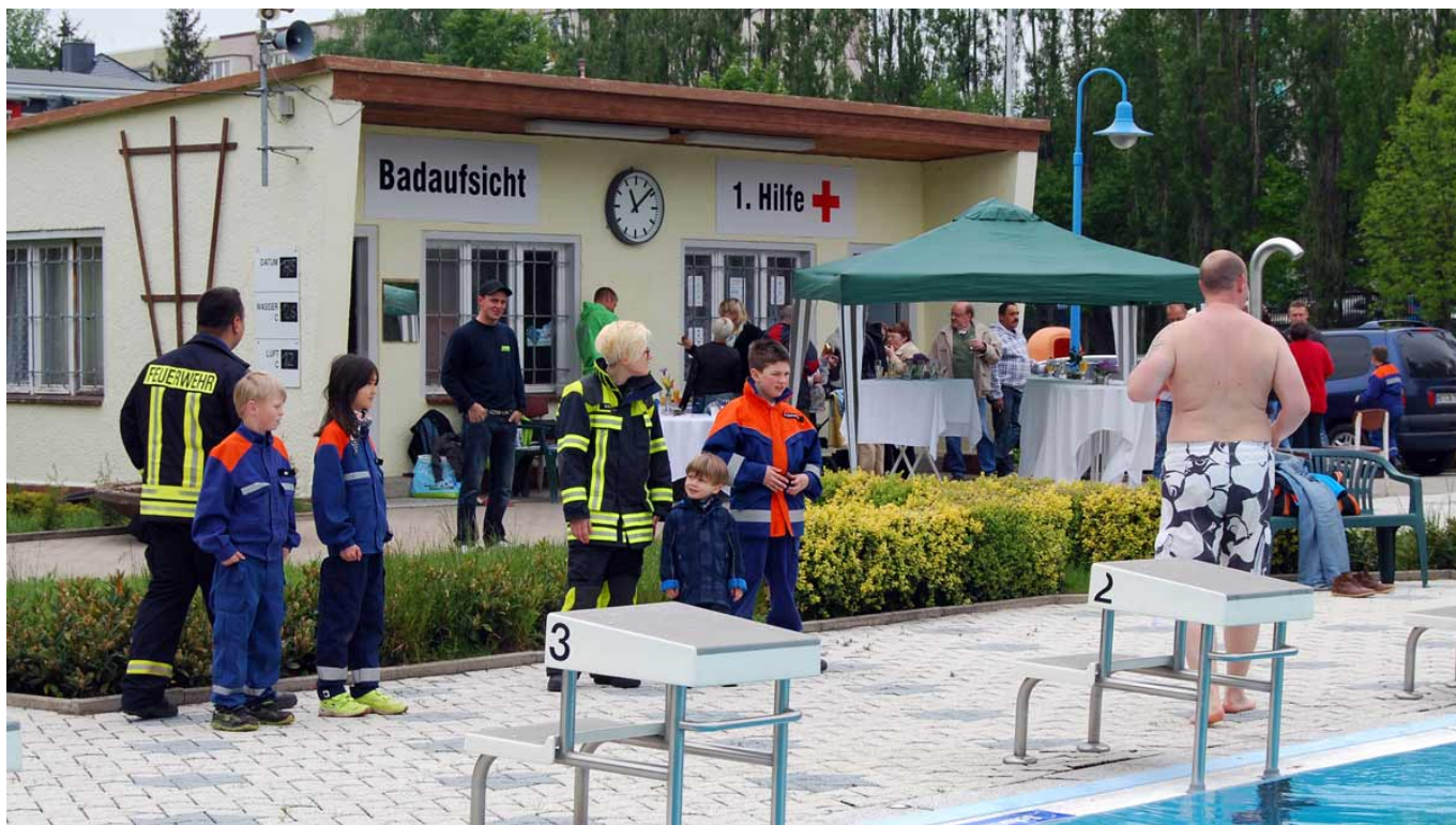
Zum Anbaden kamen durchaus einige Schaulustige vorbei