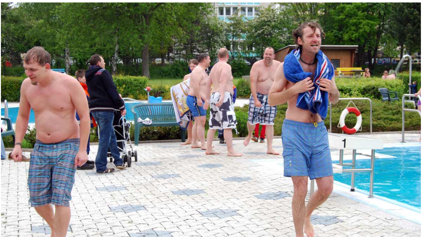
Nur kurz konnte man es im kalten Wasser aushalten