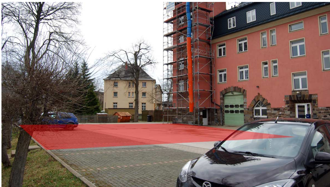
_ Fläche des Anbaus auf dem Hof (rot markiert)

Neben dem Anbau einer Fahrzeughalle mit drei LKW-Stellplätzen entstehen im Erdgeschoss des bisherigen Gerätehauses neue Umkleibereiche mit direkt zugänglichen Dusch- und Waschgelegenheiten sowie neue Räume im 1. Obergeschoss, die u.a. für die Jugendfeuerwehr genutzt werden sollen. Gleichzeitig müssen Maßnahmen durchgeführt werden, die für die verschiedensten Bereiche Mindesttemperaturen und eine Mindestbeleuchtung sicherstellen. Zudem müssen neue technische Möglichkeiten zur Sicherstellung der Zutrittsberechtigung und Zutrittskontrolle geschaffen werden.