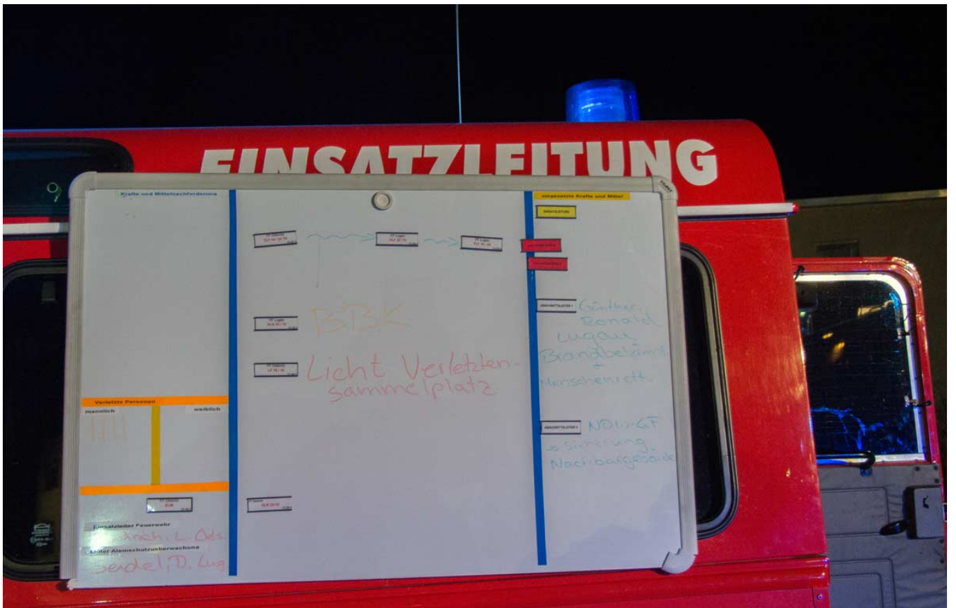
_ Lagekarte am ELW - Bildrechte: Thomas Helbig