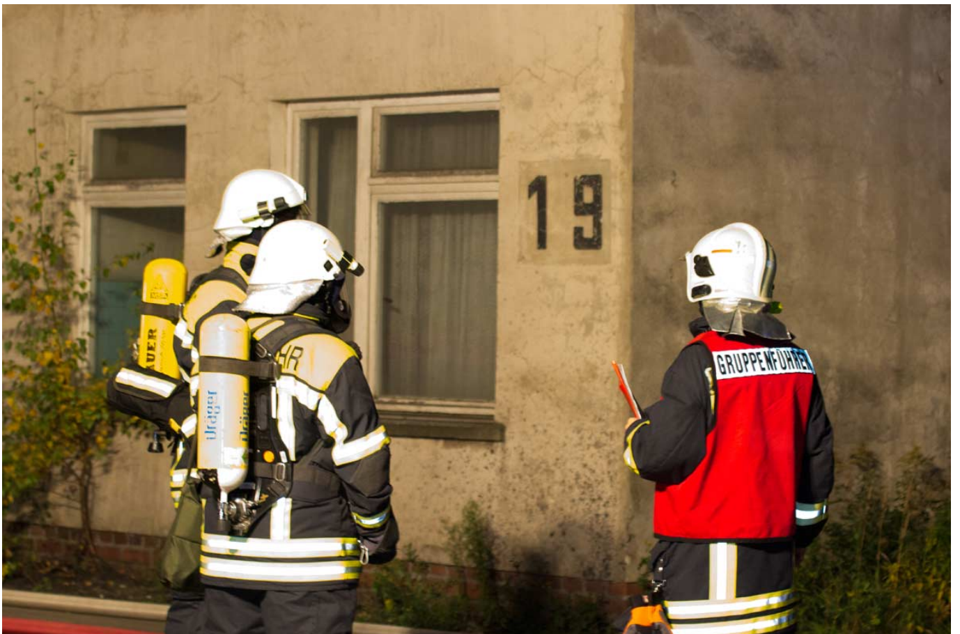
_ Einsatzbefehl an den Trupp