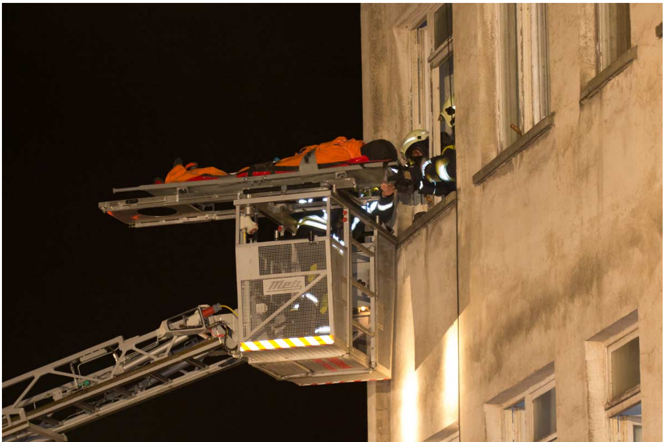
_ Personenrettung über die Drehleiter