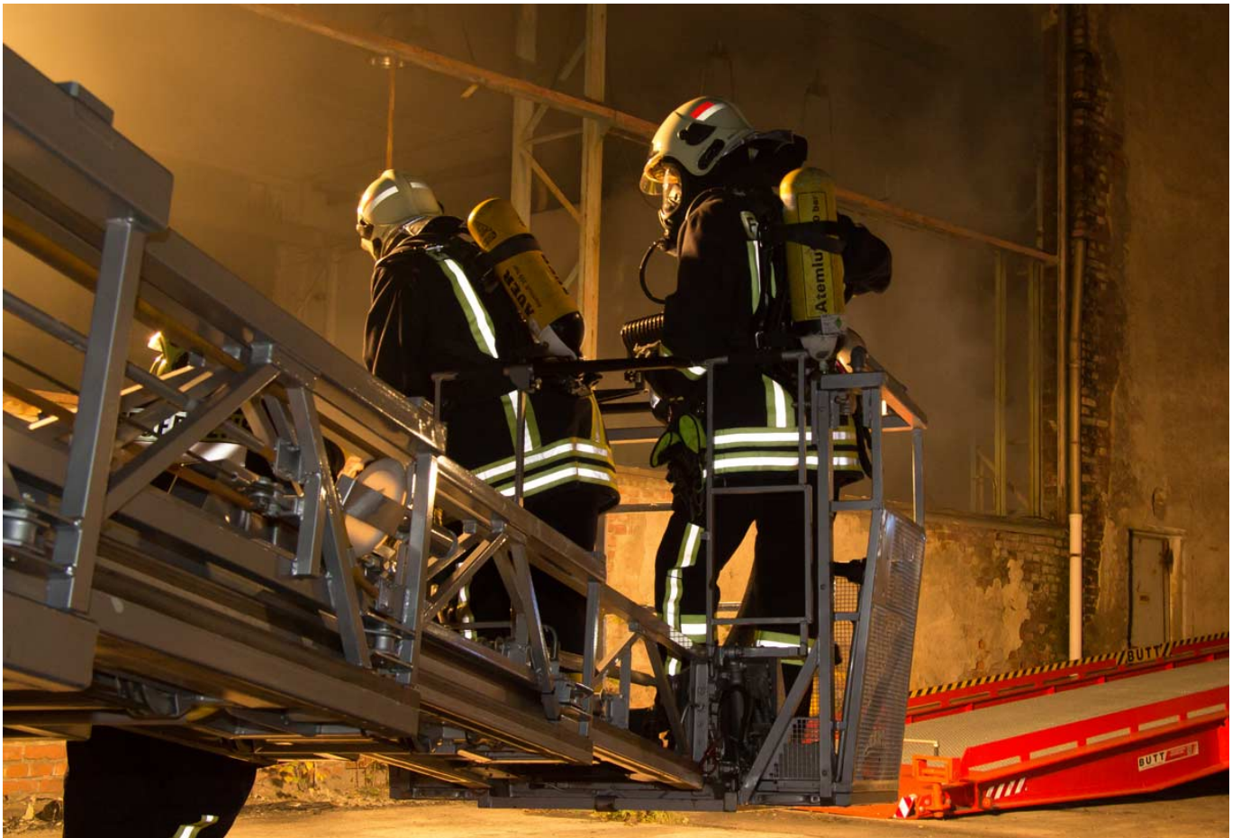
_ Arbeit im Drehleiterkorb