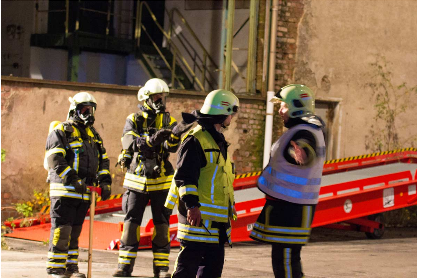
_ Absprache der Führungskräfte