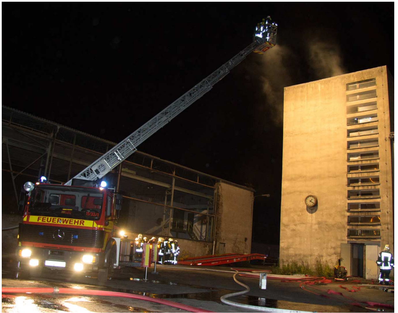
_ Arbeiten über die Drehleiter