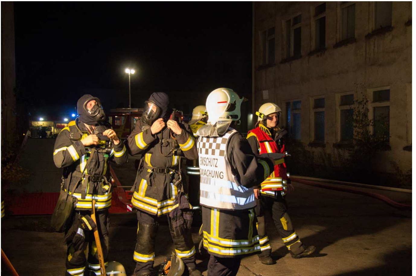
_ Nach dem anstrengenden Atemschutzeinsatz