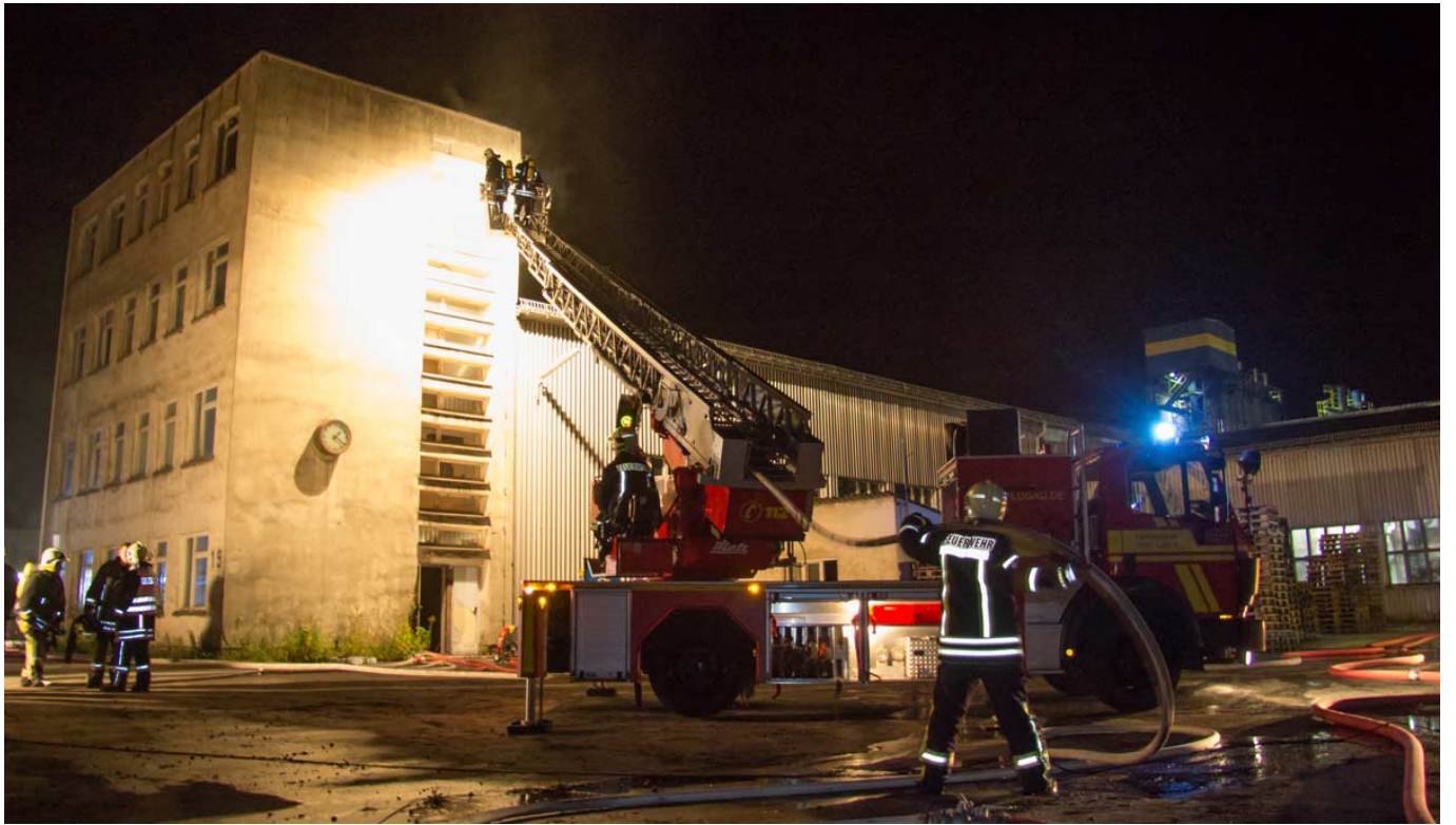
— Die Einsatzstelle