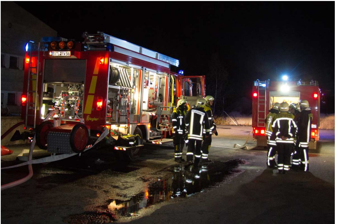
_ Aufbau nach der Ankunft am Einsatzort.