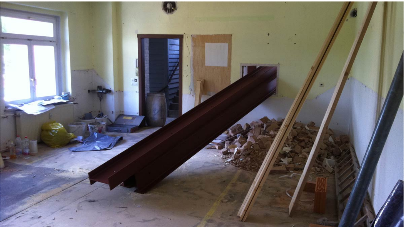
_ Noch mehr Stahlträger