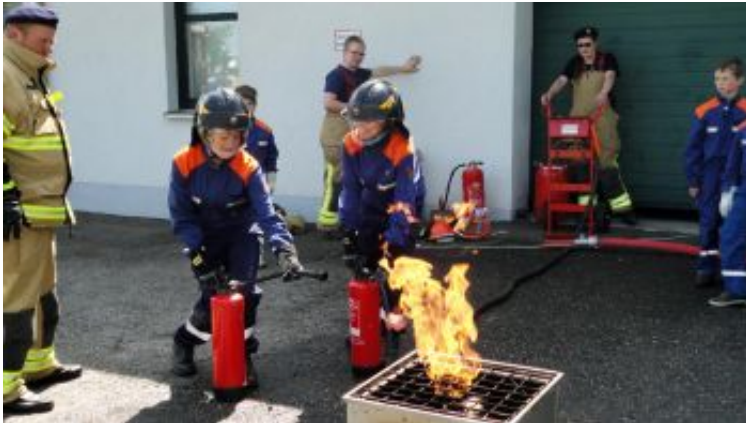
Löschversuche am Brandsimulationsgerät -

26.05.2012 18:02 von Sven Schimmel (Kommentare: 0)