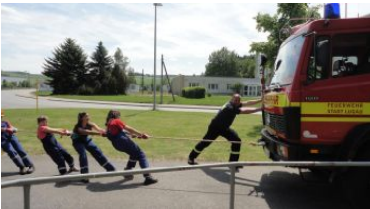
"Zieh das TLF"

Ob nun eine Trage auf die Thalheimer Drehleiter zu montieren, ein Defibrillator zu bedienen, allerhand rund um die technische Rettung zu erledigen oder gar eine Gasflamme zu löschen war, die Teilnehmer wurden nicht müde, neugierige Fragen zu stellen und selbst Hand anzulegen.